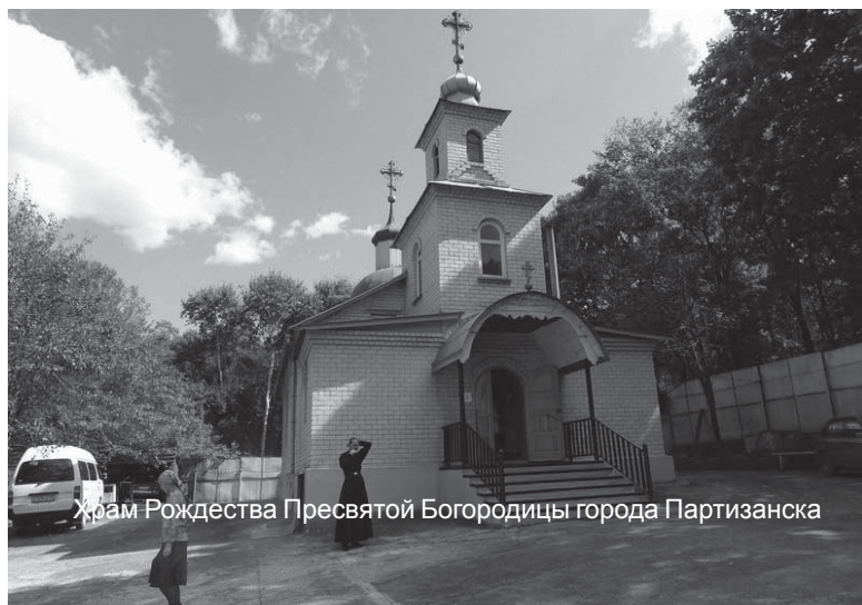
Храм Рождества Пресвятой Богородицы города Партизанска

Михаил КРАСИЛЬНИКОВ, Наталья ДОБРОГОРСКАЯ Из публикации в журнале «Русский дом»