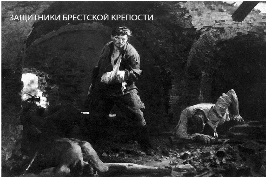
ЗАЩИТНИКИ БРЕСТСКОЙ КРЕПОСТИ

22 июня 1941 года фашистская Германия, вероломно нарушив договор о ненападении, перешла границу Советского Союза: началась Великая Отечественная война, самая тяжелая и жестокая в истории нашего государства.